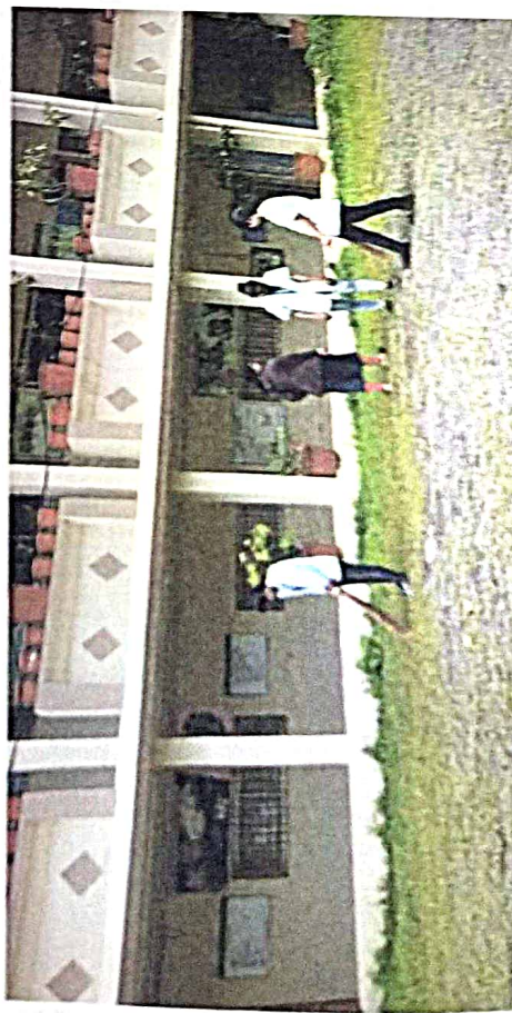
H956+8CG, Road, Manchi, Maharashtra 413714, India Manchi Maharashtra India 24°C 75°F 2022-08-10(Wed) 10:57(am)