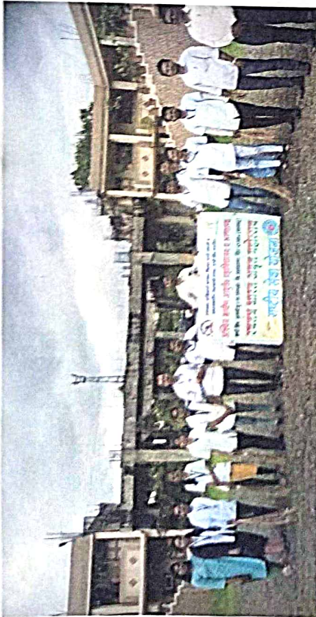
H956+8CG, Road, Manchi, Maharashtra 413714, India Manchi Maharashtra India 24°C 75°F 2022-08-10(Wed) 10:55(am)